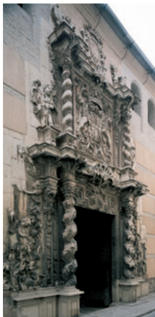
Palacio de Guevara o Casa de las Columnas.